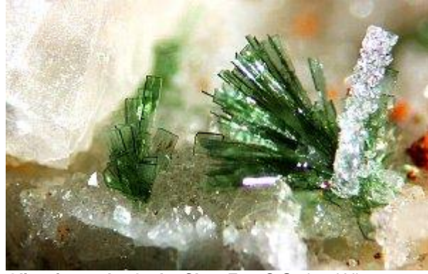
Gerhard Niceus ist ein exzellenter Fotograf Olivenit aus der Grube Clara

G. Niceus ist ein ausgezeichnete Kenner der Mineralien der Grube Clara - wir freuen uns auf einen interessanten und farbenprächtigen Vortrag.