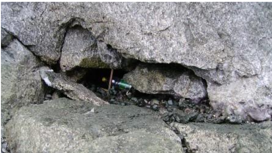
Kristallkluft im Mont Blanc-Granit